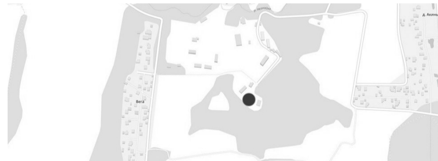
СХЕМА 2 временного складирования снега в зимний период 2021-2022 гг. на территории поселения Марушкинское с муниципальных ОДХ в г. Москве